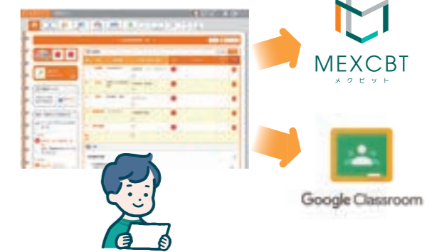
▼スクールライフノート

「スクールライフノート」に新たに学習eポータルの機能が追加されました。画面上でMEXCBTやGoogle Classroomの情報を表示できます。複数のサービスに都度ログインすることなく、手軽にアクセスも可能です。