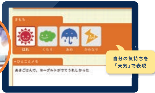
▼児童生徒の入力画面

文部科学省の「誰一人取り残されない学びの保障に向けた不登校対策（COCOLOプラン）」でも、「ICTの活用による子どもの心や体調の変化を把握すること」の重要性が強調されています。「スクールライフノート」には、天気マークだけでなく、児童生徒が先生を選んで相談できる「相談」機能も搭載。教室では言いにくい児童生徒の悩みや相談も、しっかりキャッチできます。